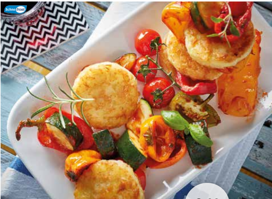
15111 Röstinchen die beliebte Rösti-Spezialität aus frischen Kartoffeln, fein gewürzt und schnell zuzubereiten, 38 g/Stück, 2 x 2,5 kg/Karton ca. 0,09 €/Stück | 6,10 €/Beutel 12,20 €/Karton