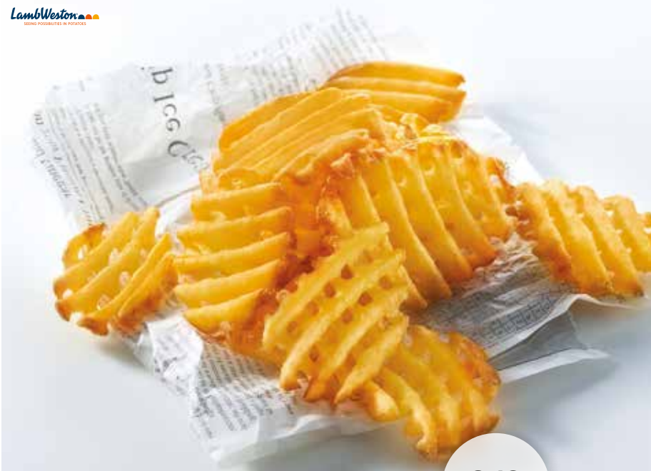
15510 LW Seasoned CrissCuts aus der ganzen Kartoffel geschnitten und geschmacklich genau so lecker wie sie aussehen 4 Beutel à 2,5 kg/Karton 7,98 €/Beutel | 31,90 €/Karton