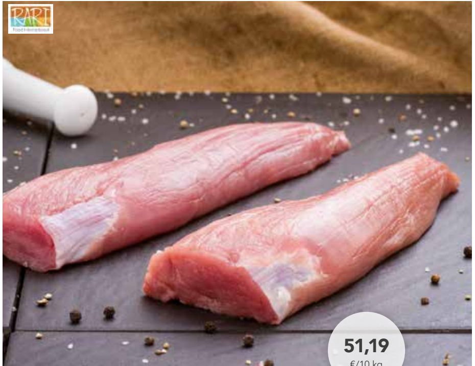
70520 Schweinefilet ohne Kopf, ohne Kette, einzeln vac.

Auch wenn die letzte Zeit geprägt von Krisen und Unsicherheiten war und leider immer noch ist, möchten wir dennoch positiv in die Zukunft blicken und Ihnen in den Topstars Januar weiterhin hochwertige Produkte zu Top-Konditionen anbieten.